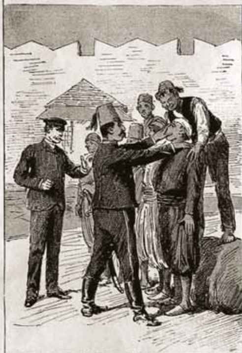
IN WHICH TASK, AND IN GROUPING THEM ARTISTICALLY, HE RECEIVES ABLE AND VALUABLE ASSISTANCE FROM AN INTELLIGENT SOLDIER