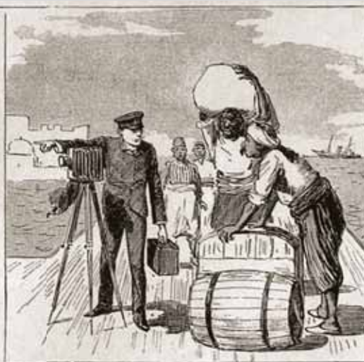
AND ENDEAVOURS TO EXPLAIN THAT HE WANTS TO TAKE A GROUP OF THEM