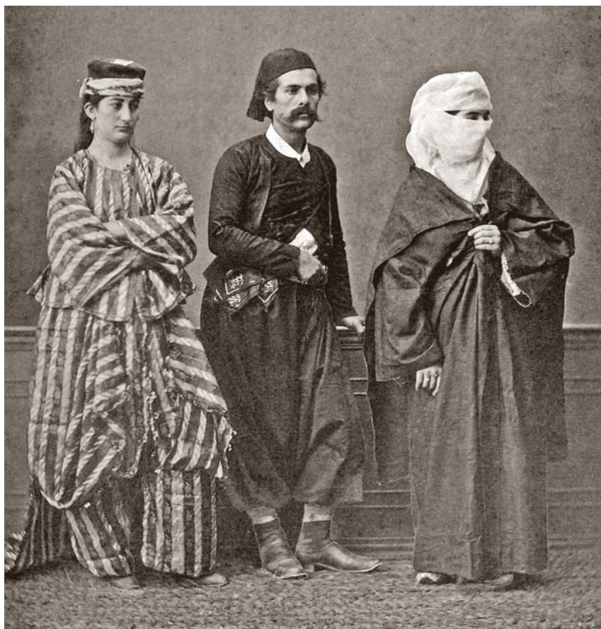
Οικογένεια Μουσουλμάνων της Ρόδου.