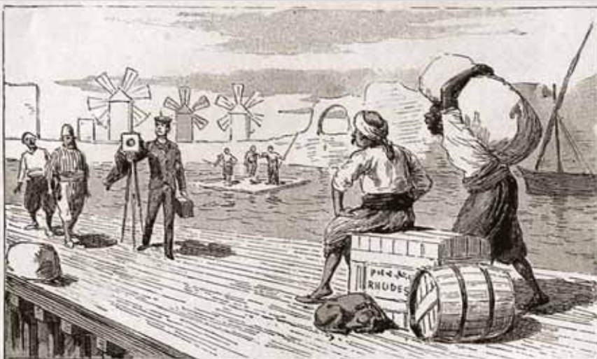
HE IS VIEWED WITH INTEREST, NOT UNMIXED WITH AWE, BY THE NATIVES ON LANDING