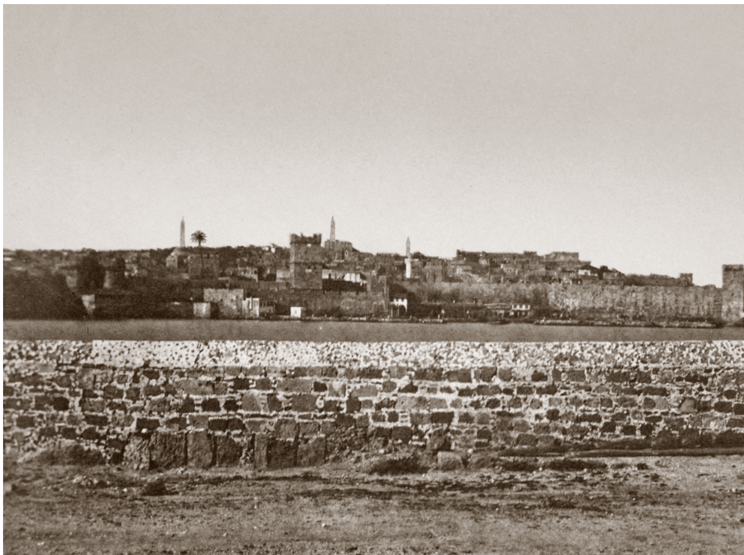
Γενική άποψη της Παλιάς Πόλης το 1850.

Οι πρώτες φωτογραφίες της Ρόδου τραβήχτηκαν από τον Claudius Galen Wheelhouse, κατά τη διάρκεια ενός ταξιδιού του στη Μέση Ανατολή με ενδιάμεσο σταθμό τη Ρόδο.