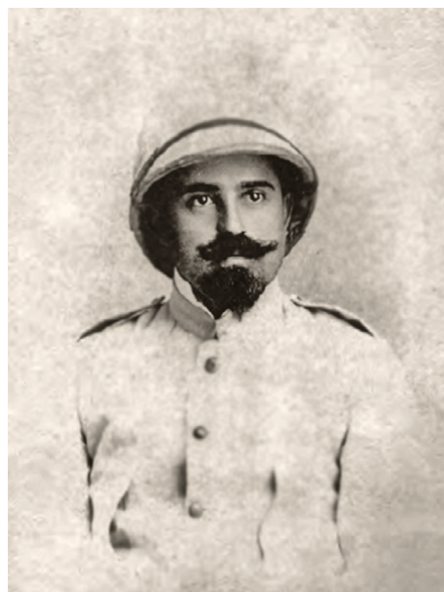
Ο Ιταλός αρχαιολόγος Giuseppe Gerola

Τον Μάιο του 1912, φθάνει στη Ρόδο ο Ιταλός αρχαιολόγος Giuseppe Gerola, κατόπιν εντολής του ιταλικού Υπουργείου Παιδείας, για να συντάξει κατάλογο των Μεσαιωνικών μνημείων της Δωδεκανήσου. Τα πορίσματα των ερευνών του συνοδεύονταν από πλήθος φωτογραφιών και αποτέλεσαν τη βάση για τις ανασκαφές και τις εργασίες αναστήλωσης που ακολούθησαν τα επόμενα χρόνια από τους Ιταλούς. Στους τρεις μήνες της παραμονής του στα Δωδεκάνησα ο Gerola αποτύπωσε στις φωτογραφίες του ένα αρχειακό υλικό πολύτιμο για τους ερευνητές, αλλά συγχρόνως και μια καλλιτεχνική ματιά καθώς έστρεψε το φακό του σε παιδικά πρόσωπα και στους κατοίκους με τις παραδοσιακές φορεσιές.