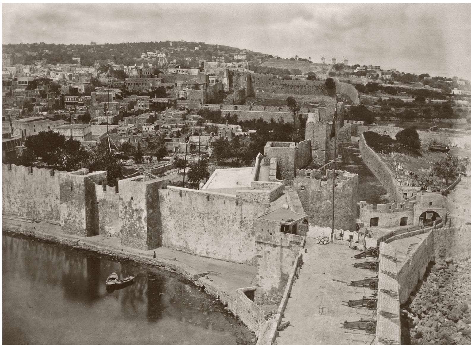
(National Gallery of Canada)