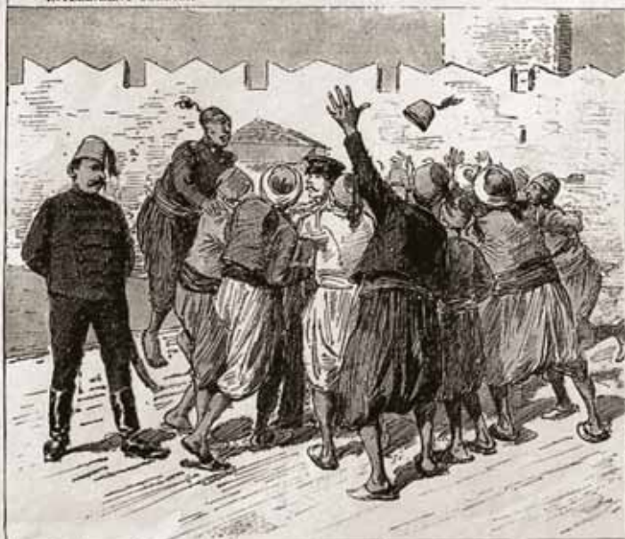
CURIOSITY TO SEE THE INTERIOR ECONOMY OF THE CAMERA THEN PREVAILS