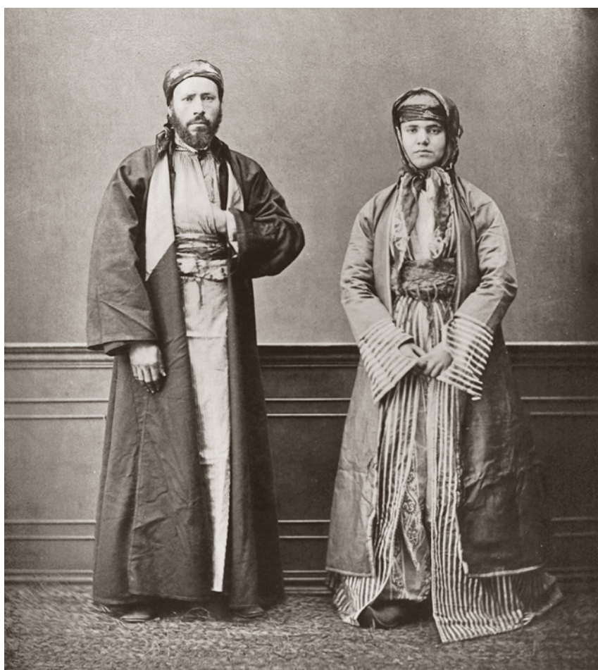
Οικογένεια Εβραίων της Ρόδου.