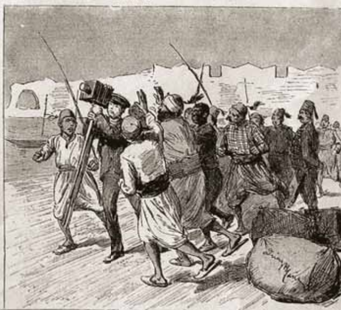
AND OUR DOCTOR THINKS IT THE BEST PLAN TO RETURN QUIETLY TO THE BOAT WITHOUT FURTHER DELAY