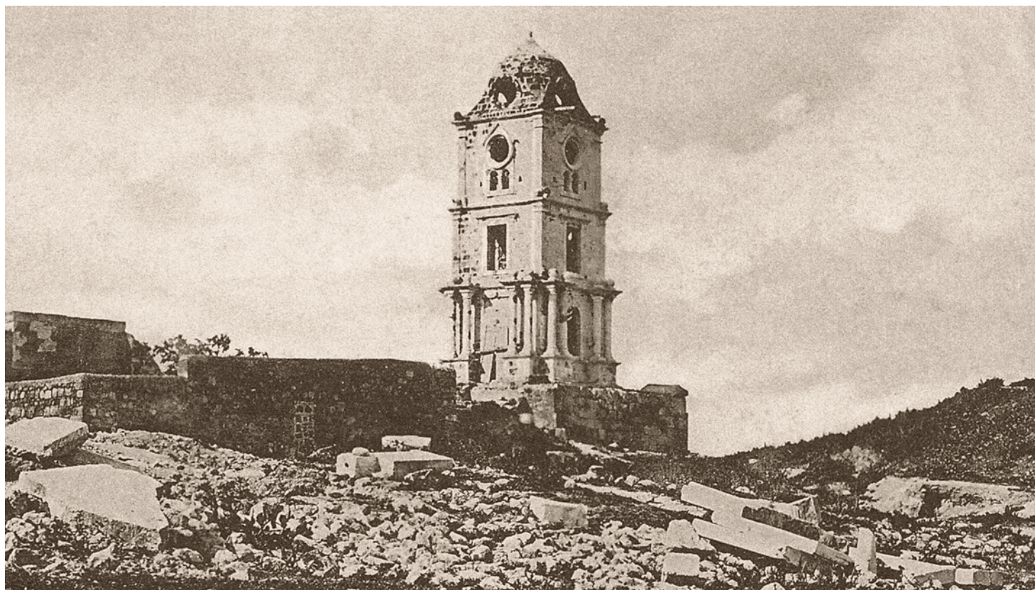
Ο Πύργος του Ρολογιού, ανάμεσα στα ερείπια του ναού του Αγ. Ιωάννου και των γύρω κτισμάτων, μετά την ανατίναξη τους το 1856 από την έκρηξη της πυρίτιδας που βρισκόταν εντός του καθεδρικού ναού των Ιπποτών, και τον καταστρεπτικό σεισμό του 1863.

Ε ίμαστε ακόμη υπό την φοβερή επίδραση που μας προξένησε η θλιβερή νύχτα στις 22 Απριλίου. Νύχτα αγωνίας και τρόμου που η ανάμνηση θα μείνει για καιρό ζωντανή στη θύμηση των δύστυχων κατοίκων της Ρόδου. Από μερικές μέρες ήδη φυσούσε με ασυνήθιστη βιαιότητα βόρειος άνεμος, διώχνοντας μερικά μαύρα σαν πίσσα σύννεφα. Αν παρατηρούσε κανείς τον ουρανό με αυτή τη θέα θα έβρισκε ότι υπήρχε κάτι το απειλητικό, δεν ξέρω προμηνυόταν συμφορά σ' αυτή τη σκοτεινή νύχτα. Μια δροσιά τελείως αφύσικη γι' αυτή την εποχή ήταν αισθητή.