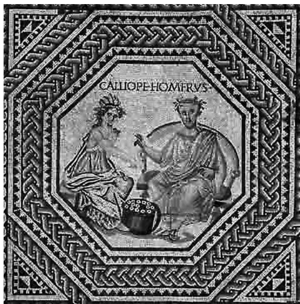
Ο Όμηρος και η Καλλιόπη, μούσα της επικής ποίησης, σε ρωμαϊκό ψηφιδωτό (240 μ.Χ.)