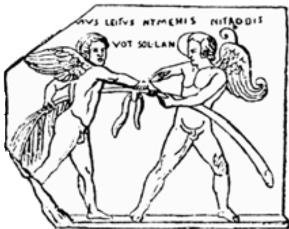
Έρως και Αντέρως.