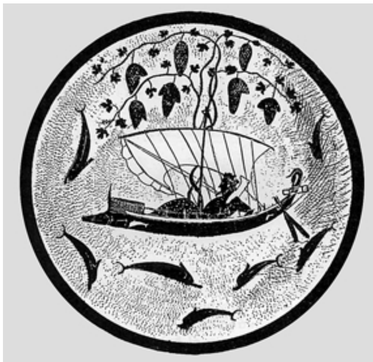
Ο θεός Διόνυσος ταξιδεύει (Εσωτερικό από κύλινδρο του αγγειογράφου Εξηκία).

προκαταρκτικές θυσίες. Ύστερα καθοριζόταν η σειρά προτεραιότητας, συνήθως με κλήρωση. Είναι γνωστό ότι το μαντείο παραχωρούσε μερικές φορές σε πόλεις ή και σε ιδιώτες το τιμητικό δικαίωμα της προμαντείας –το προνόμιο να παίρνουν πρώτοι χρησμό– λόγω της καλής συμπεριφοράς τους προς αυτό. Καθώς αναφέρει ο Ηρόδοτος, τέτοιο δικαίωμα προμαντείας είχαν παραχωρήσει οι Δελφοί στο βασιλιά των Λυδών Κροίσο, ο οποίος υπήρξε πολύ γενναιόδωρος προς το μαντείο 14 . Και πρέπει να σημειώσουμε ότι το δικαίωμα αυτό, εκτός του ότι ήταν πολύ τιμητικό, είχε και πρακτική ωφέλεια, αν αναλογισθούμε τα πλήθη του κόσμου που συνωστίζονταν στο μαντείο, ιδιαίτερα στα χρόνια της ακμής του.