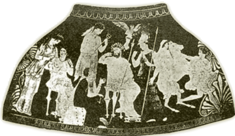
Συμβούλιο του Δία και της Θέμιδας. Ο Δίας κάθεται σε θρόνο, στο κέντρο μπροστά, ενώ η Θέμις καθισμένη επάνω στο δελφικό ομφαλό (αριστερά και χαμηλότερα), φαίνεται να μιλά ζωηρά χειρονομώντας με το αριστερό χέρι. (Από παράσταση αγγείου).

“Ότε τόν Ἑρωτα ἡ Ἀφροδίτη ἐγέννησε, τά μὲν ἄλλα καλός τε ἦν ὁ παῖς καί τῇ γεννησάσῃ προσήκων, ἀτάρ οὐκ ἠϋξετό γε εἰς μέγεθος τῷ κάλλει πρέπον, οὐδέ ἐπεδίδου τό σῶμα, ἀλλ’ ἔμενε πλεῖστον χρόνον οἷος ἐτέχθη. ἤπορεῖτο γοῦν πρὸς τό πρᾶγμα ἥ τε μήτηρ καί αἱ τροφοί τοῦ βρέφους αἱ Χάριτες, καί φοιτῶσαι παρὰ τήν Θέμιν –οὔπω γάρ εἶχε Δελφούς ὁ Ἀπόλλων– ἐδέοντο λύσιν τινά ἐξευρεῖν τῆς ἀτόπου καί θαυμαστῆς συμφορᾶς. εἶπεν οὖν ἡ Θέμις· ἀλλ’ ἐγὼ παύσω ὑμᾶς ἀπορουμένας· νῦν γάρ οὔπω ἵστε τήν φύσιν τοῦ βρέφους. ὁ Ἑρως ὁ σός ὁ ἀληθινός, ὃ Ἀφροδίτη, τεχθεῖ μὲν ἄν ἴσως καί μόνος, ἀνξηθεῖ δ’ ἄν οὐδαμοῦ μόνος, ἀλλὰ σοι δεῖ καί Ἀντέρωτος, εἰ βούλει ἀνξηθῆναι τόν Ἑρωτα. ἔσται δέ αὕτη φύσις τοῖσδε τῆς ἀδελφοῖς· ἀλλήλοισι αἵτιοι τῆς αὔξης ἄμφω γενήσονται. ὀρῶντες μὲν γάρ ἀλλήλους ἴσα βλαστήσουσι, θατέρου δέ ἀπολειφθέντος ἄμφω μειώσονται 11 .