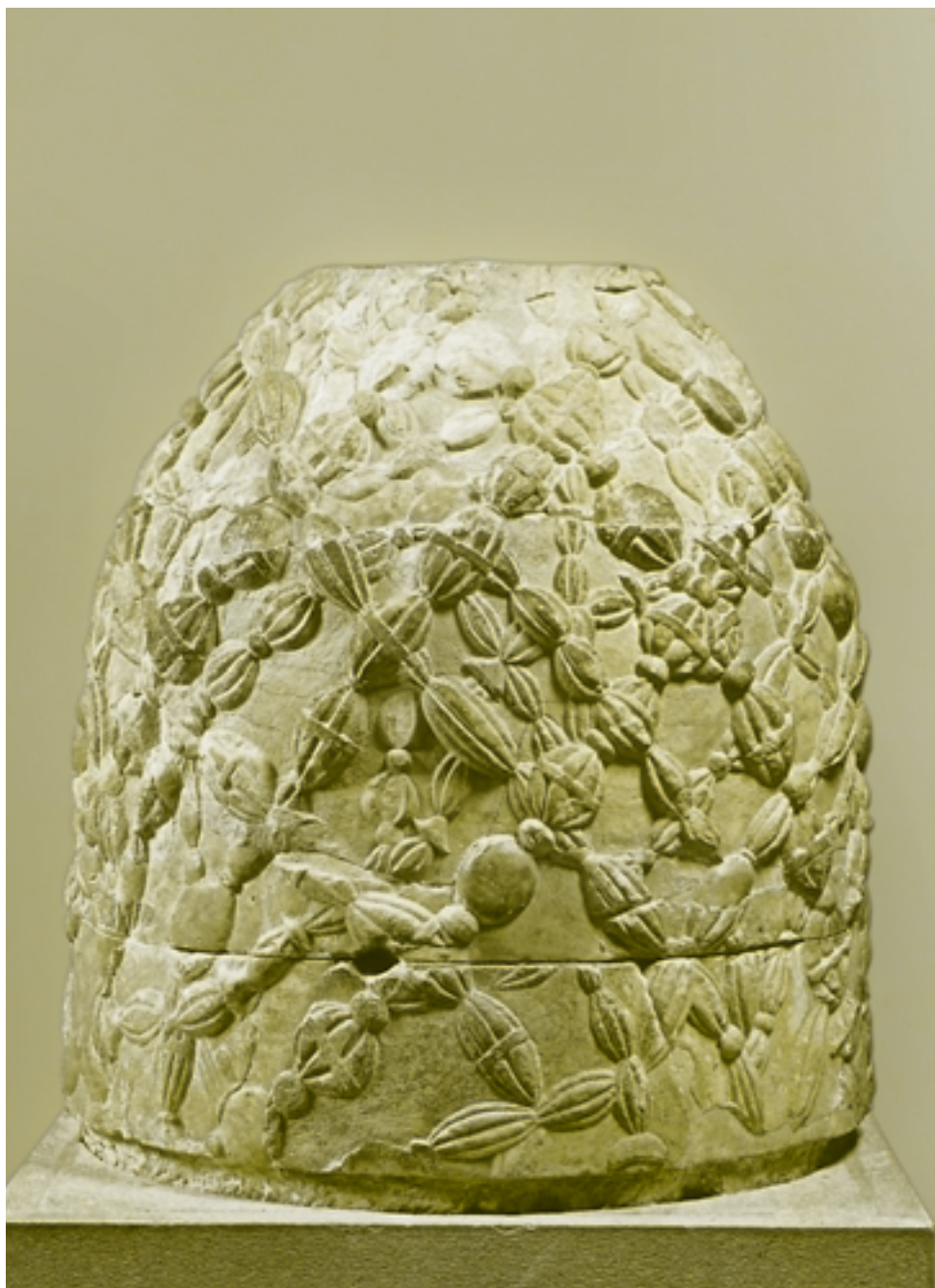
Μαρμάρινος «ομφαλός» των Δελφών.