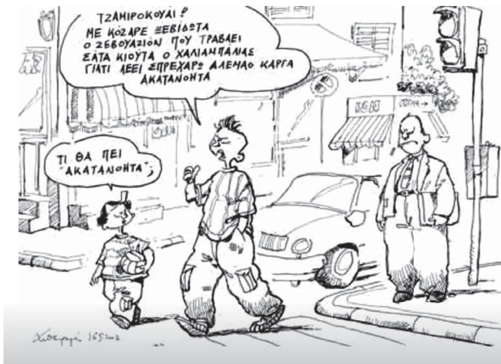
Του Ανδρέα Πετρουλάκη