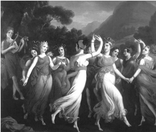
Οι Μούσες στην αρχαία ελληνική μυθολογία είναι εννέα αρχαίες θεότητες, κόρες του Δία και της Μνημοσύνης. Ο Απόλλωνας ήταν ο ηγέτης τους (Απόλλων Μουσαγέτης).

Η Ελληνική μυθολογία, από τις σπουδαιότερες των αρχαίων λαών, είναι πλούσια πηγή, κοσμολογικών, θρησκευτικών και πολιτισμικών αντιλήψεων των προγόνων μας. Οι θεοί και οι ήρωες της, είναι πλασμένοι από τα όνειρα και τους πόθους των Ελλήνων. Περιέχει αρκετά στοιχεία, από τα οποία, μπορούμε να γνωρίσουμε και να κατανοήσουμε, τον τρόπο σκέψης, τον πολιτισμό και την κοινωνική ζωή των ανθρώπων της αρχαίας Ελλάδος.