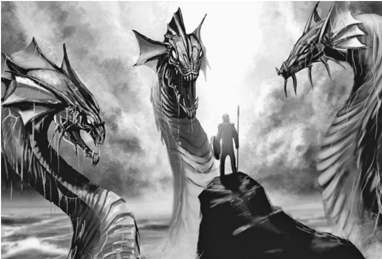
Ο μύθος της Ύδρας και του Ηρακλή

Οι μύθοι είναι τα πρώτα δημιουργήματα της ελεύθερης σκέψης και της φαντασίας του ανθρώπου. Υπάρχουν σε όλες τις χώρες του κόσμου και σε όλες τις εποχές, διότι υπηρετούν πολιτικές, κοινωνικές και πολιτισμικές ανάγκες. Συντηρούν εθνικούς πόθους, κρυφές ελπίδες και φιλοδοξίες της κάθε φυλής. Αποτελούν την παράδοση και τον πολιτισμό κάθε λαού. Είναι η ψυχή του.