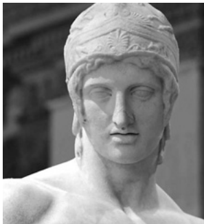
Ο Άρης - θεός του πολέμου Άγαλμα του Borghese - Λούβρο.

Προικίζουν τους ήρωες τους με ομορφιά, νοημοσύνη και ανώτερη δύναμη. Δίνουν ερμηνείες, σε ανεξήγητα με την κοινή λογική, φυσικά φαινόμενα και κοσμικά γεγονότα. Επειδή οι άνθρωποι αρέσκονται, στα ωραία, τα μεγάλα και τα απρόσιτα, στους μύθους βρίσκουν και τα δικά τους οράματα και τις δικές τους προσδοκίες. Με την αληθοφάνεια και το δυναμισμό που περιέχουν, γίνονται εύκολα και πρόθυμα αποδεκτοί.