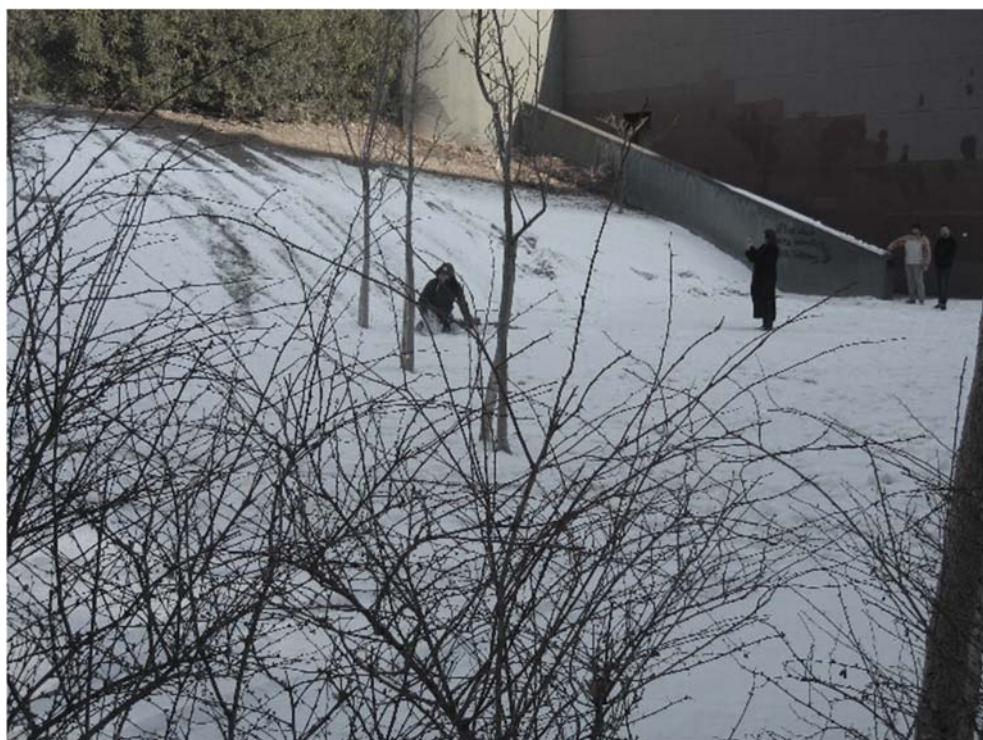
Εικ. 5: Αύλειος χώρος ΔΠΜΣ Αρχιτεκτονική Τοπίου ΠΣ ΑΠΘ.