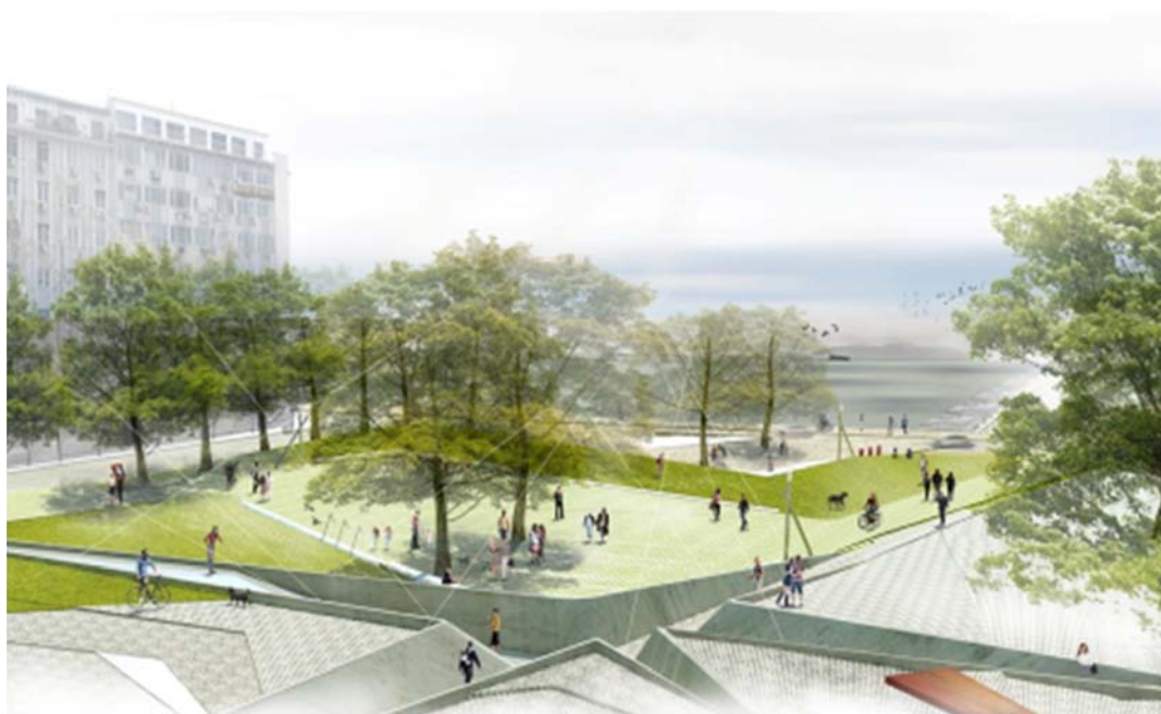
Εικ. 4: Πλατεία Ελευθερίας, Θεσσαλονίκη, Διαγωνισμός 2014.

Έργα μου (εικ. 3, 4, 5) επιλεκτικά παρουσιάζονται με τη διάταξη που και στην πρόσκληση AIAPP, Μιλάνο 2007, υποστηρίζουν τη μελέτη αρχιτεκτονικής τοπίου για διαφορετικές κλίμακες και περιβάλλοντα έτσι ώστε τα νέα τοπία της κοινωνίας να σχεδιάζονται στηριγμένα στη φυσική και πολιτισμική τους δυναμική.