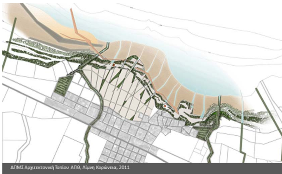
Εικ. 2: Από το μάθημα Τεχνικά Έργα και Σχεδιασμός Τοπίου, ΔΠΜΣ Αρχιτεκτονική Τοπίου ΑΠΘ.

Όχι ψευδεπίγραφα, με γνώση, σύνεση και πολιτική ευθύνη. Αυτή που μας ανήκει. Με αναγνώριση της κοινωνικής αναγκαιότητας, της ιστορικής μας ευθύνης και της δυναμικής του ίδιου του αντικειμένου.