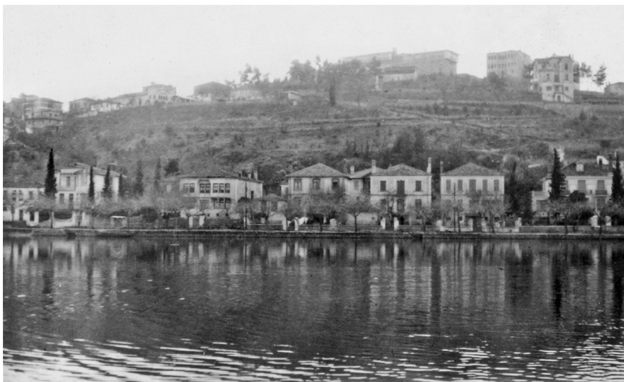
Οι νεόκτιστες επαύλεις των Η. Δαή, Χ. Νάντσου, Α. Μυλωνά, Οικονομίδη και Β. Δαή. (Αρχείο οικ. Νάντσου)