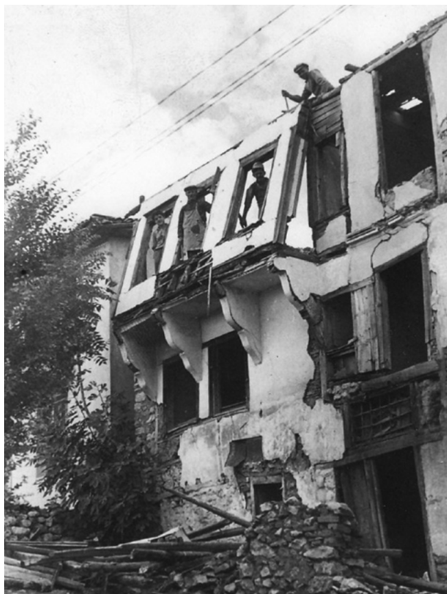
Κατεδαφίζοντας το αρχοντικό Μπαρμπατσούλη για να χτιστεί η εκλεκτικιστική μονοκατοικία το 1934.