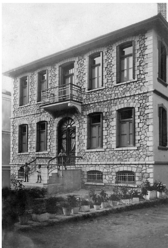
Η νεόκτιστη οικία Νάντσου.