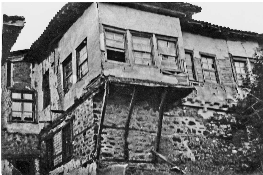
Αρχοντική οικία. Βρισκόταν επί της οδού Χριστοπούλου απέναντι από την εκκλησία των Ταξιαρχών.